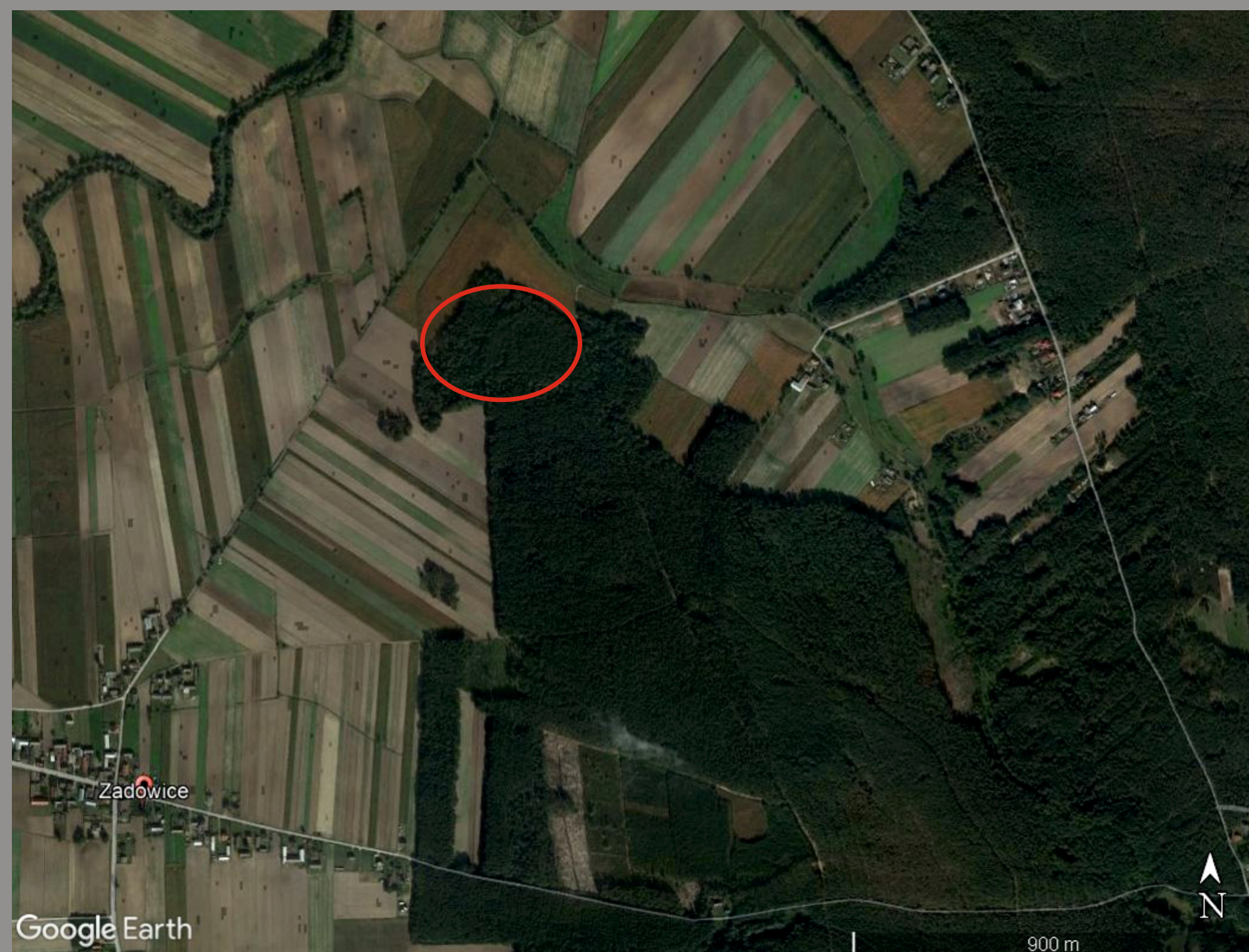
położenie cmentarzyska w Zadowicach

Przygotowanie do druku i druk opracowania stanowiska I w Zadowicach dofinansowano ze środków Ministra Kultury i Dziedzictwa Narodowego pochodzących z Funduszu Promocji Kultury.