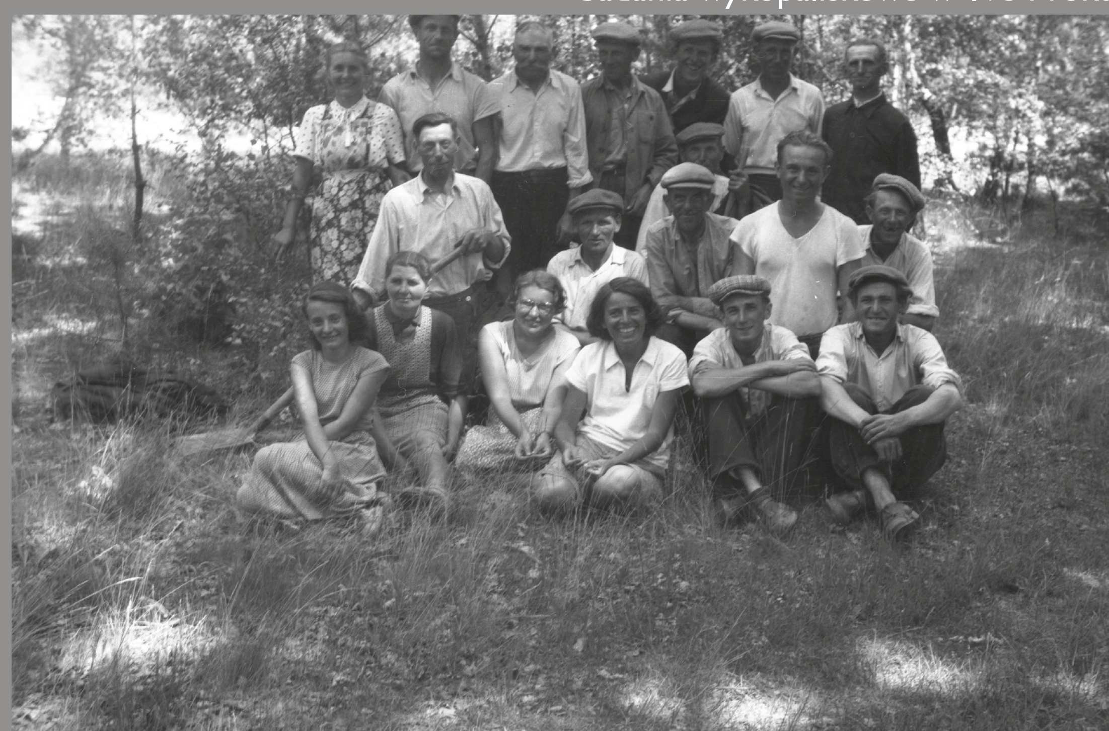
grupa pracowników, badania wykopaliskowe w 1959 roku

oprac. dr Wojciech Siciński, Elżbieta Górka