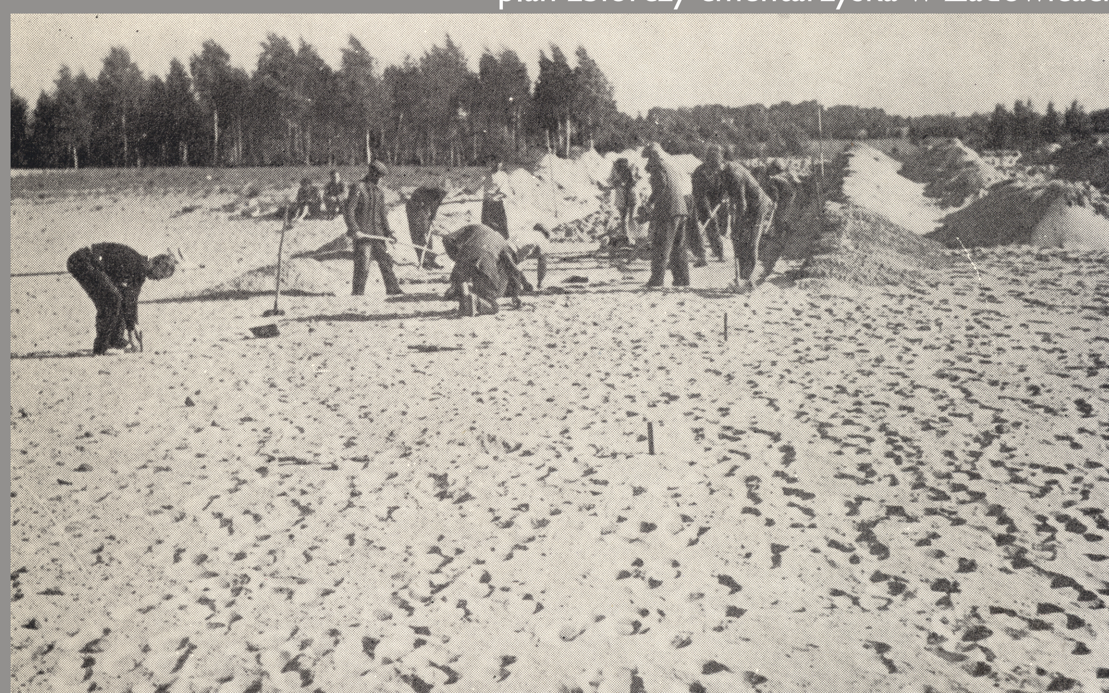
badania wykopaliskowe w 1954 roku