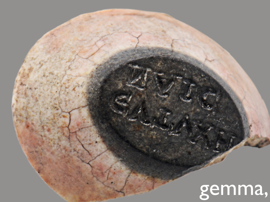
gemma, badanie 1970, znalezisko luźne