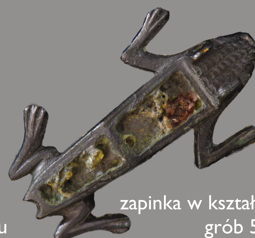
zapinka w kształcie jaszczurki grób 535