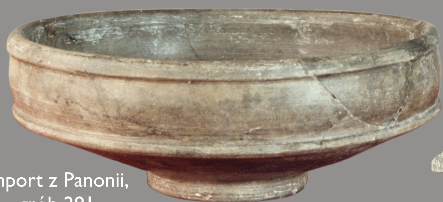
import z Panonii, grób 281