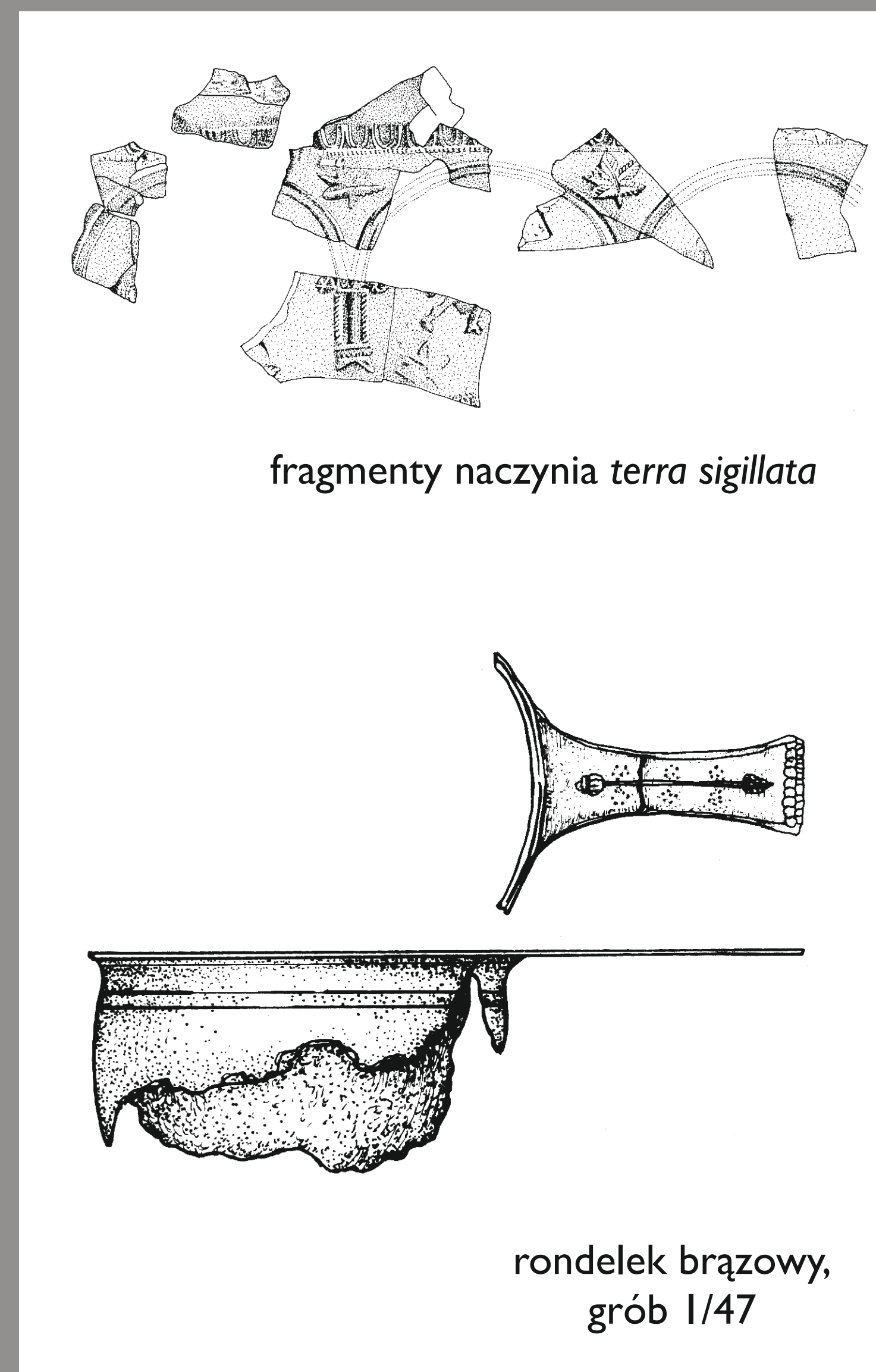
fragmenty naczynia terra sigillata

Z innych znalezisk na cmentarzysku należy wymienić „skarb” narzędzi żelaznych odkryty w północnej części cmentarzyska. W jego skład wchodziły: radlica, krój radła, półkosek i wiertło.