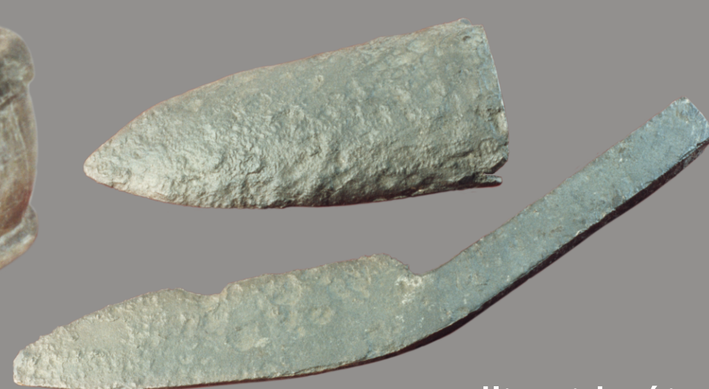
radlica i krój pochodzące ze skarbu